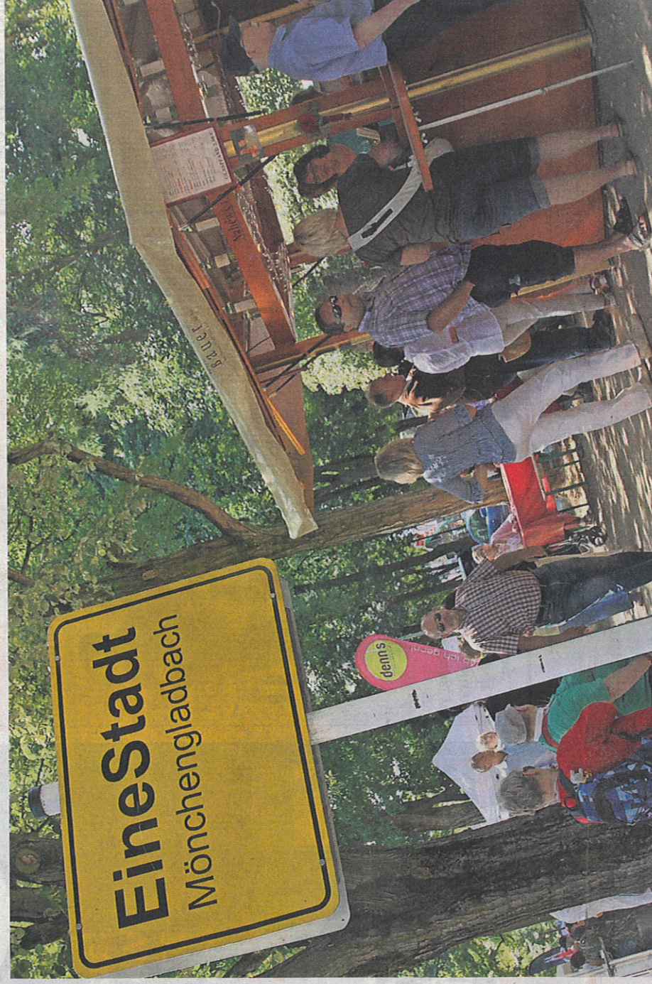
Auf Brucknerallee und Richard-Wagner-Straße, zwischen Rheydt und Mönchengladbach, gibt es am Wochenende wieder einiges zu entdecken.

Von Freitag bis Sonntag steigt die elfte Auflage des EineStadt-Festes. Zu entdecken gibt es Kulinarisches, Künstlerisches und Musikalisches.