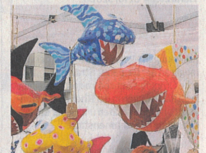
Supersüße Haifische gab es an einem Stand zu kaufen.