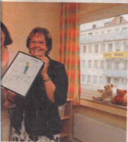
nd Innovationsmanagements bei Vodafone, er Spendenübergabe.