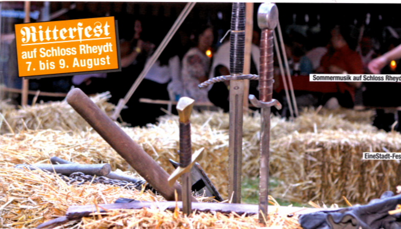
Sommermusik auf Schloss Rheydt

Nitterfest auf Schloss Rheydt 7. bis 9. August