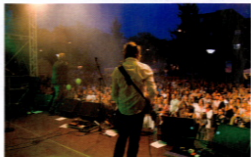
Stimmung ohne Ende mit zahlreichen Live-Bands.

Im vergangenen Sommer besuchten ca. 170.000 Gäste das städteverbindende Fest auf der ehemaligen Stadtgrenze. An diesem Er-