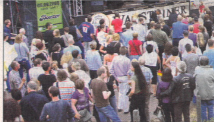
Rund 170.000 Menschen besuchten 2008 das Eine-Stadt-Fest.