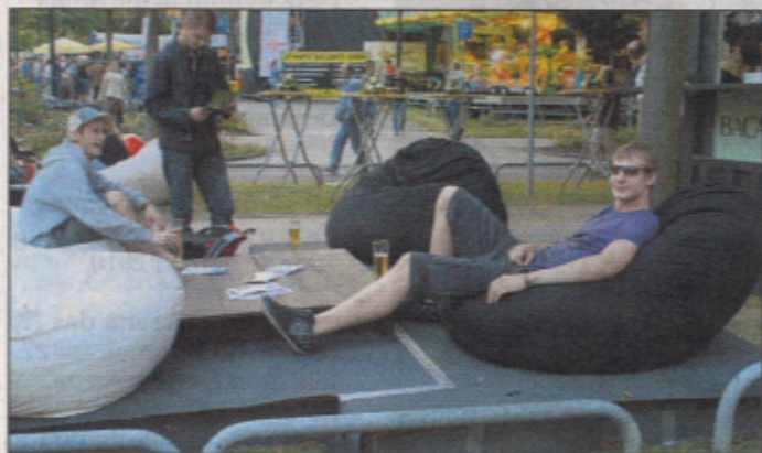
Ein Plätzchen zum Relaxen gibt es auch.

Mönchengladbach. Im vergangenen Sommer besuchten das städteverbundene Fest etwa 170.000 Leute. Darunter auch viele Kinder. Den Veranstaltern des Eine-Stadt-Festes, welches vom 14. bis zum 16. August stattfindet, liegt das Wohl und die Unterhaltung der kleinen Besucher immer besonders am Herzen. So wird auch in diesem Jahr die große „Kids-World“ auf der Breite Straße mit neuen, spannenden Attraktionen versehen sein. Eine Neuerung ist zum einen das große Bungee-Trampolin mit einer Sprunghöhe von etwa 9 Metern. Befestigt durch zwei Gummiseile werden die Springer sanft aufgefangen. Bei den Mutigen sorgt der Salto für atemberaubende Momente.