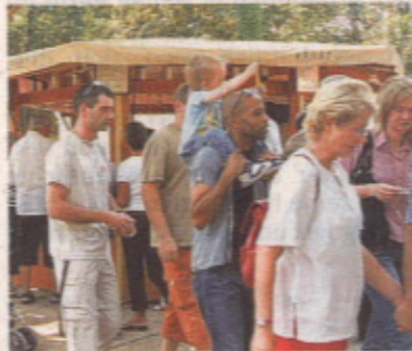
Rund 170 000 Besucher lockt das Fest jedes Jahr an.

Was erwartet die Besucher, die das Fest fest in ihren Terminkalender eingetragen haben? Auf jeden Fall die Möglichkeit, sich ausgiebig an den kulinarischen Ständen aufzuhalten und zahlreiche Leckereien zu genießen. Neben internationalen Spezialitäten gibt es erstmals auch Bio-Produkte beim Eine-Stadt-Fest. Und wer so gestärkt vielleicht ein Mitbringsel für die Lieben