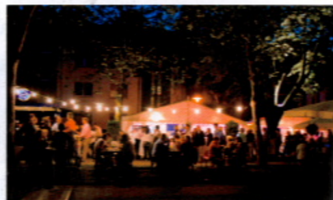
Die kulinarische Meile: schlemmen und flanieren.

Bereits zum siebten Mal lädt das EineStadt-Fest die Mönchengladbacher zum ausgelassenen Feiern und Flanieren ein. Bei erfahrungsgemäß gutem Wetter locken die kulinarische Meile, das abwechslungsreiche Musikprogramm und der Kunst- und Handwerkermarkt die Besucher unter den freien Himmel. In der Kids World dürfen sich die kleinen Besucher austoben, während die Eltern in Ruhe bummeln gehen können.