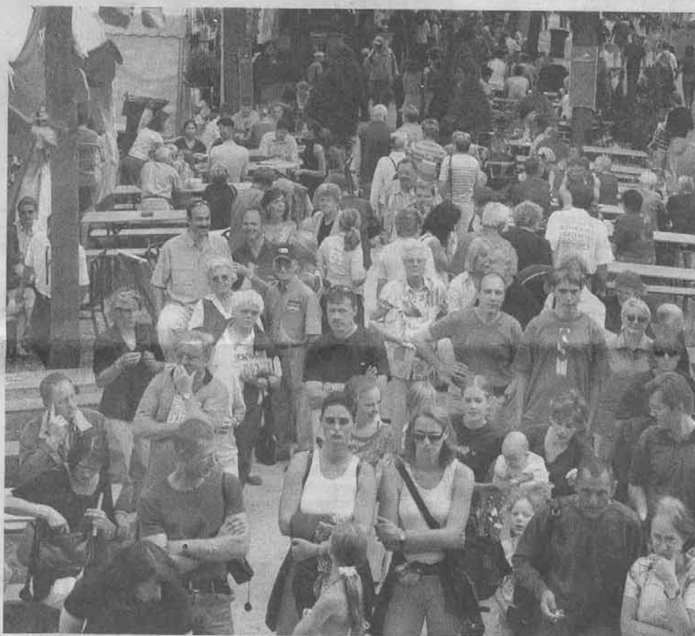
Blick auf Besucher beim Eine-Stadt-Fest : Auch in diesem Jahr hoffen die Organisatoren wieder auf ein reges Interesse an ihrer Veranstaltung, die erneut an der ehemaligen Stadtgrenze Gladbach-Rheydt stattfindet.

Eine Veranstaltung, die laut Rothermel ankommt: „Ich war mir erst nicht sicher, ob wir den Aufwand noch einmal auf uns nehmen sollten. Nach langem Überlegen, haben wir uns wegen der großen Resonanz aus der Bevölkerung und der Unterstützung der Sponsoren im letzten Jahr dafür entschieden.“ Stolz ist Rothermel darauf, dass er dieses Mal das Café Trozdem für das Projekt gewinnen konnte. Das