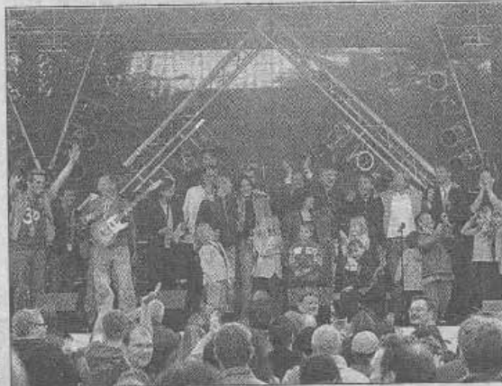
Die „MG Allstar-Band“ steht am Sonntagnachmittag auf der Bühne beim nunmehr dritten „Eine-Stadt-Fest“.