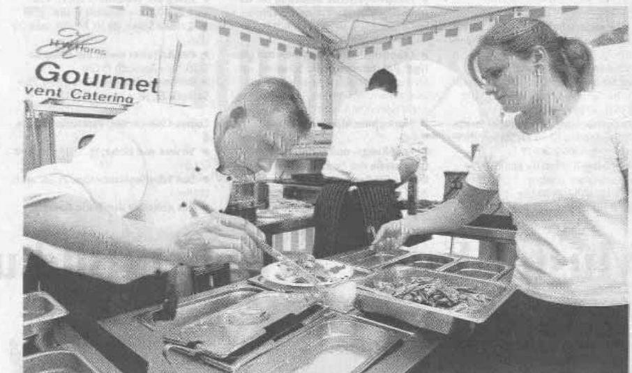
Es ist angerichtet! Die Brucknerallee verwandelte sich mit allerlei Köstlichkeiten – ungeachtet früherer Stadtgrenzen – am Wochenende beim Eine Stadt-Fest zur Gourmet-Restaurant-Meile.