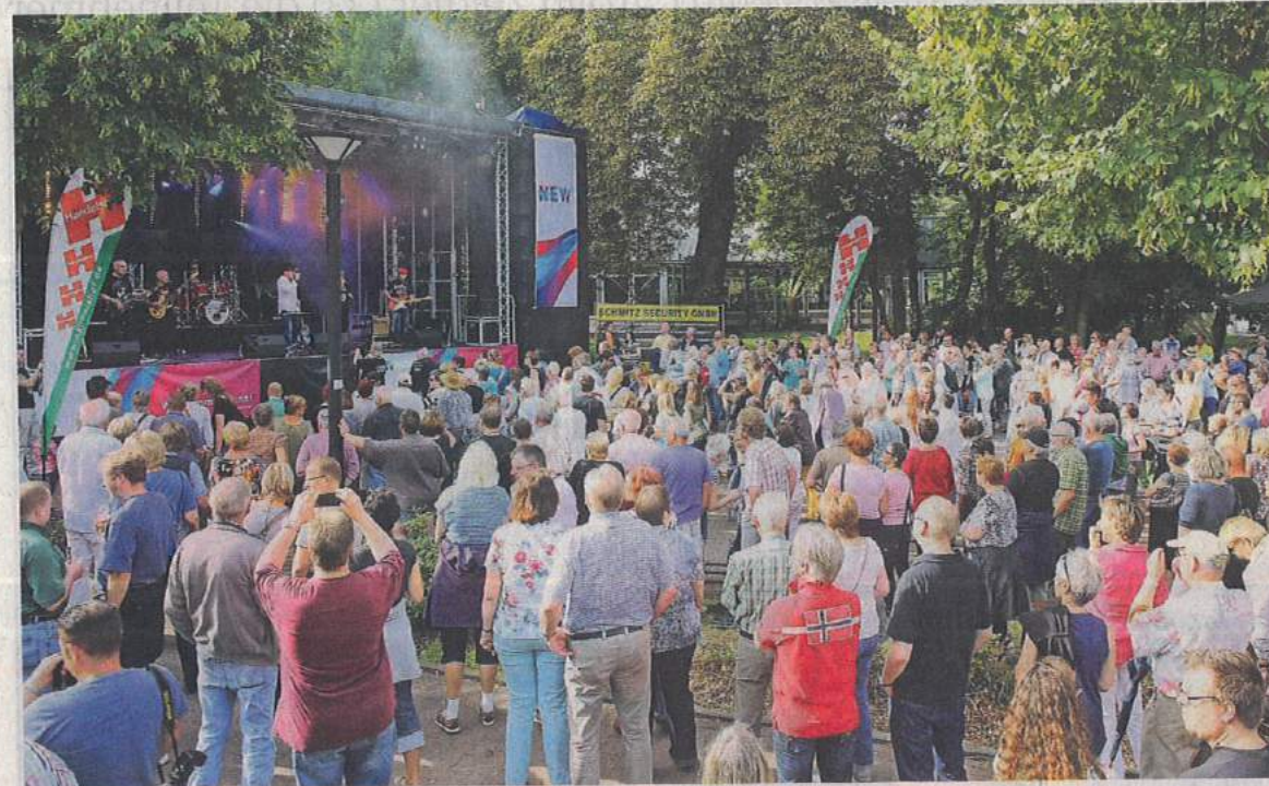
Volles Programm an drei Tagen: Das 13. Eine-Stadt-Fest lädt vom 14. bis 16. August mit vielen musikalischen Höhepunkten und kulinarischen Angeboten auf die Veranstaltungsmesse entlang der Brucknerallee und der Richard-Wagner-Straße ein.

Mit seinem Organisationsteam hat er beim Hephata Garten-Shop, einem der Kooperationspartner, das Festprogramm vorgestellt, das sich aus den bewährten Säulen Gastronomie, Musik, Kunstmarkt und Kinder-Attraktionen zusammensetzt. Auf der kulinarischen Meile entlang der Brucknerallee und der Richard-Wagner-Straße wird es dabei gegenüber dem Vorjahr Zuwachs geben. „Essen ist das neue Feiern, da legen heutzutage viele Besucher großen Wert drauf. Entsprechend haben wir das Angebot