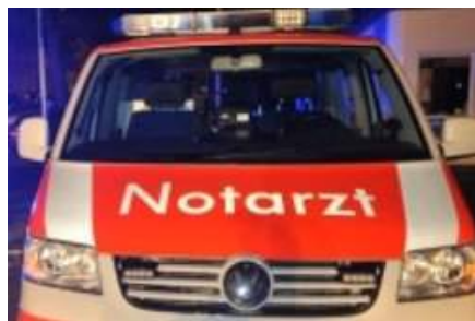
Fußgänger schwer verletzt - Autofahrer flüchtet Krefeld. Am Dienstag ist ein 44-jähriger Fußgänger von einem