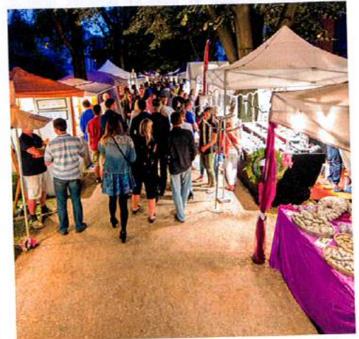
Das Herzstück der Veranstaltung ist die kulinarische Meile.

Mit weit mehr als 30 Gastronomieständen, mit mehr als 15 Kinderattraktionen, mit mehr als 100 Musikern bzw. Künstlern auf der NEW AG-Hauptbühne und mehr als 30 Ausstellern auf dem Kunsthandwerkermarkt haben sich die Veranstalter in diesem Jahr wieder ein schönes Programm für das EineStadt-Fest überlegt und umgesetzt – und das bei freiem Eintritt. Tipp: Ballonbegeisterte können während des EineStadt-Festes mit den Heißluftballonen der Skytours Ballooning GmbH abheben. Wer sich einen Platz im Korb reservieren möchte, kann sich unter 0221 355560 oder online www.skytours-ballooning.de informieren. Für die kleinen Besucher gibt