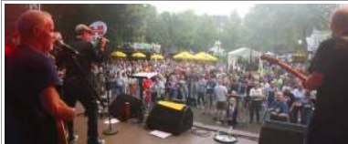
Auf der Bühne sorgten Musikgruppen für gute Stimmung unter den zahlreich erschienenen Besuchern.