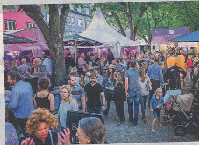
Volle Straßen, volle Stände - das ist das „EineStadt-Fest“ am kommenden Wochenende.

Mönchengladbach. Wenn Marco Rothermel an die Anfänge des „EineStadt-Festes“ zurückdenkt und sieht, was aus der vor zwölf Jahren entstandenen Idee mittlerweile geworden ist, dann überkommt ihn und das gesamte Team von Campus e.V. ein gewisser Stolz. „Es war schon ein großes Wagnis damals. Mit einer Flaniermeile von 600 Metern sind wir gestartet, jetzt sind es 1,5 Kilometer. Aus einer kleinen Keimzelle ist ein