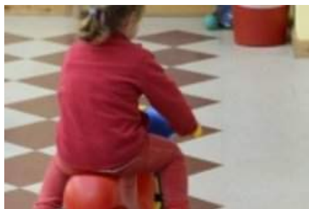
Kind fliegt aus Kita: Mutter klagt Düsseldorf. Ein Streit zwischen einer Mutter und der Leitung einer Kindertagesstätte.