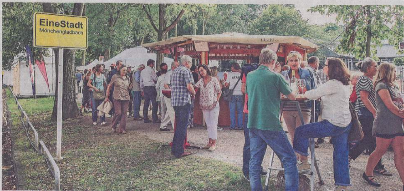
Volle Straße, volle Ständen - das ist das „EineStadt-Fest“ am kommenden Wochenende.

Mönchengladbach. Aufgrund des „EineStadt-Festes“ wird die MöBus-Linie 019 ab Donnerstag, 13. August bis einschließlich 17:00 Uhr am Montag, 17. August umgeleitet. Die Busse werden in beide Fahrtrichtungen über die Nord- sowie die Gartenstraße geleitet und die Haltestelle „Breite Straße“ wird ersatzlos aufgehoben. In dieser Zeit hält die Linie 019 Richtung Mönchengladbach HBF/Europaplatz an der Haltestelle „Amtsgericht“ der Linie 016.